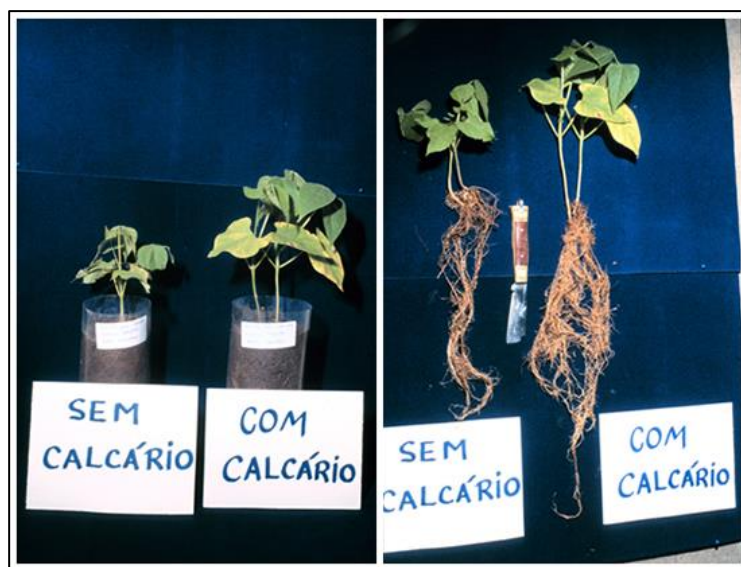
Figura 1: Efeito do calcário na planta de feijão.

Como observado em um experimento (SINDICAL, 2014), os sistemas radiculares das plantas de feijão (Fig. 1) e milho (Fig. 2), sofreram influência do calcário, aumentando de tamanho em relação a outra planta que não sofreu influência da calagem. Além disso, o calcário aumenta a eficácia dos adubos e fertilizantes aplicados nas plantas e com isso a adubação se torna mais eficiente, independentemente da cultura, e como consequência há aumento da produtividade.