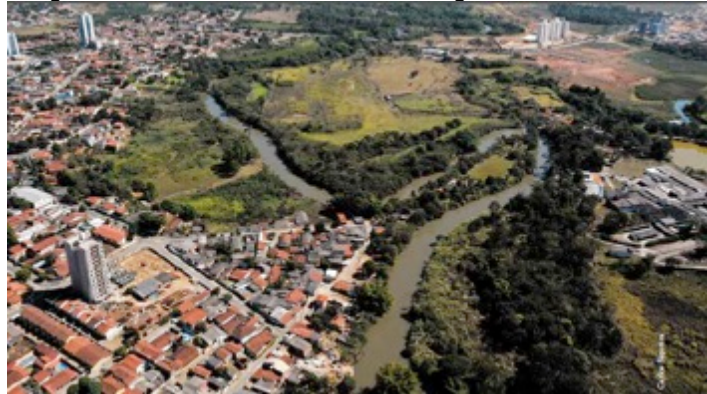
Figura 4: Invasão de Goiânia sobre as margens do rio Meia Ponte.