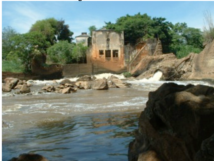
Figura 5: Usina do Jaó.