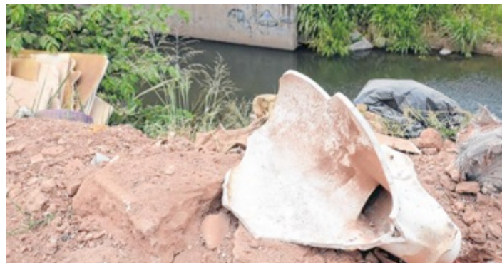
Figura 01: Situação Cursos d’água urbanos de Goiânia.