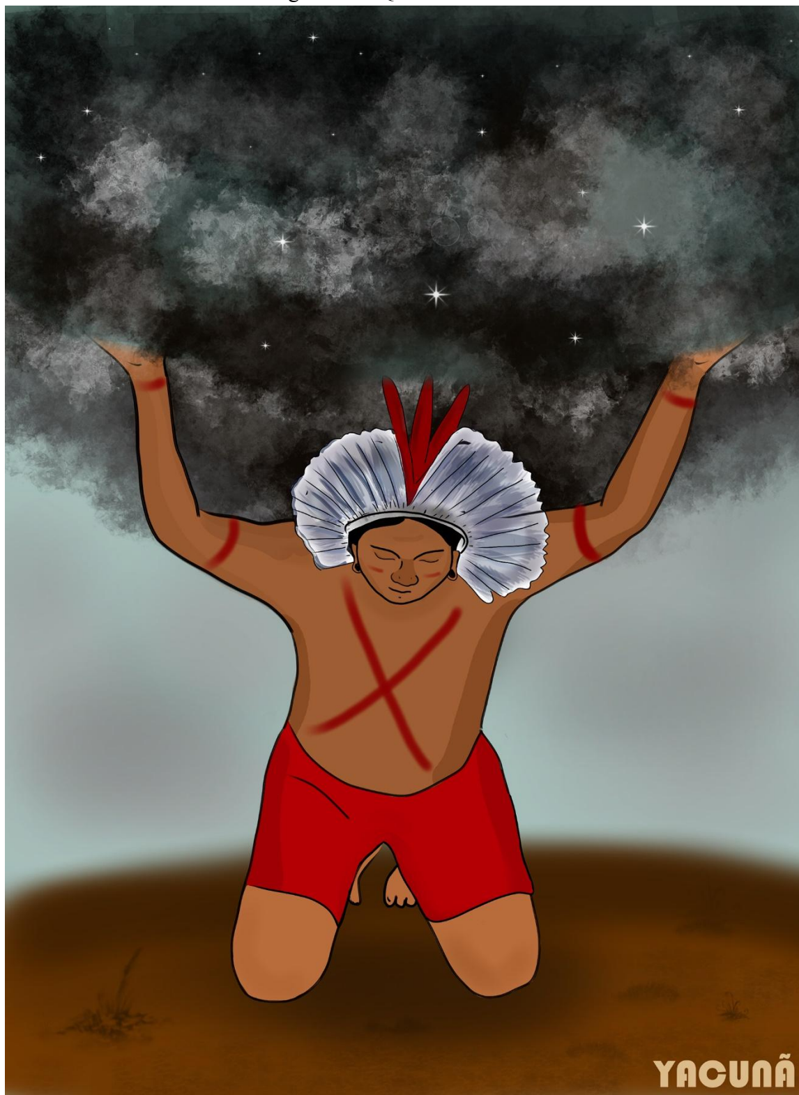
Figura 4: A QUEDA DO CÉU