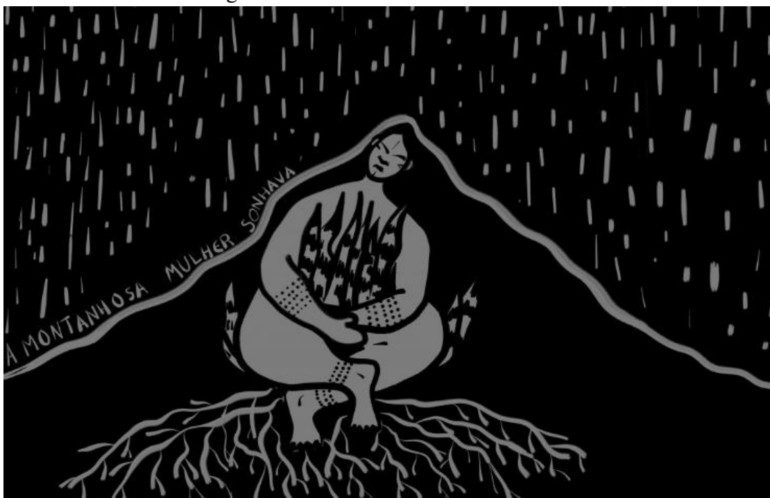
Figura 2: A montanhosa mulher sonhava.

Fonte: A ilustradora Yacunã Tuxá exalta a resistência das mulheres indígenas, 2020.