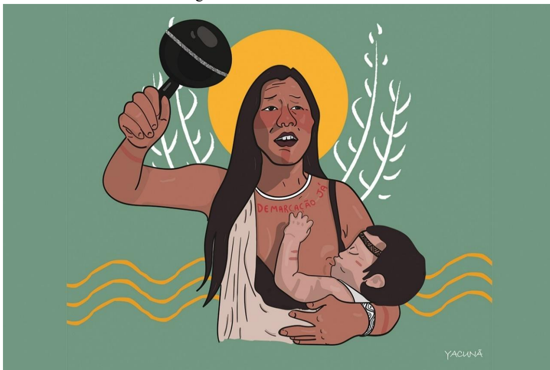
Figura 1: Título desconhecido.

Fonte: A ilustradora Yacunã Tuxá exalta a resistência das mulheres indígenas, 2020.